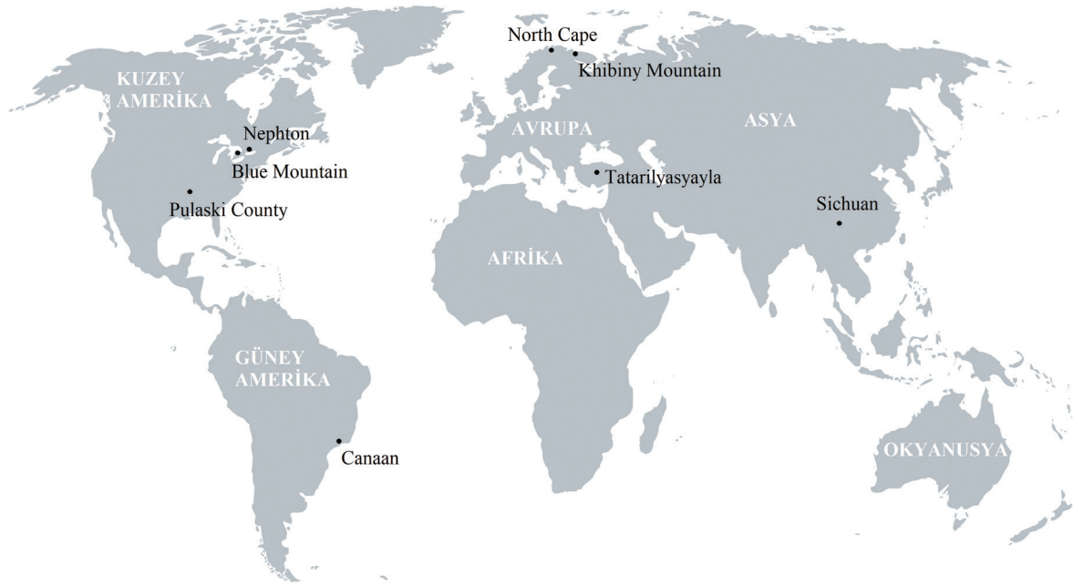
Şekil 1. Başlıca nefelinli siyenit üretilen yatakların konumu.